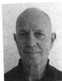
Auteur: Jan Bijstra

Afsluitend: het is dus goed om als leraar alert te zijn op het gebruik van handelingen die (veelal onbewust) het incident rekken en die al snel leiden tot een nieuw incident. De uitkomsten leiden tot de conclusie om handelingen (negeren, time-out, straf) te vermijden die ertoe kunnen leiden dat de leerling zich niet gehoord of begrepen voelt. Gebruik meer op de emotie gerichte handelingen omdat die kunnen bijdragen aan het realiseren van een goede relatie. Eens te meer blijkt dat een goede leraar-leerlingrelatie bijdraagt aan het voorkómen en oplossen van incidenten.