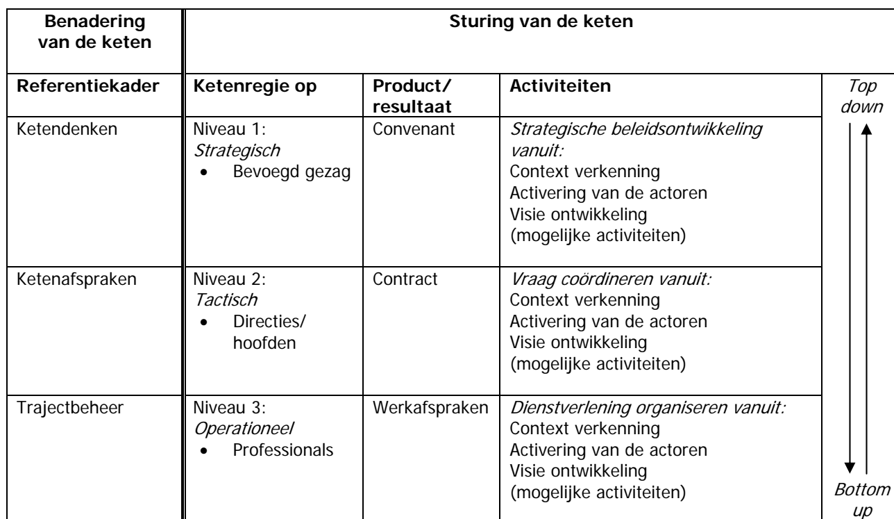
Figuur 3: Proces onderwijzorgketen